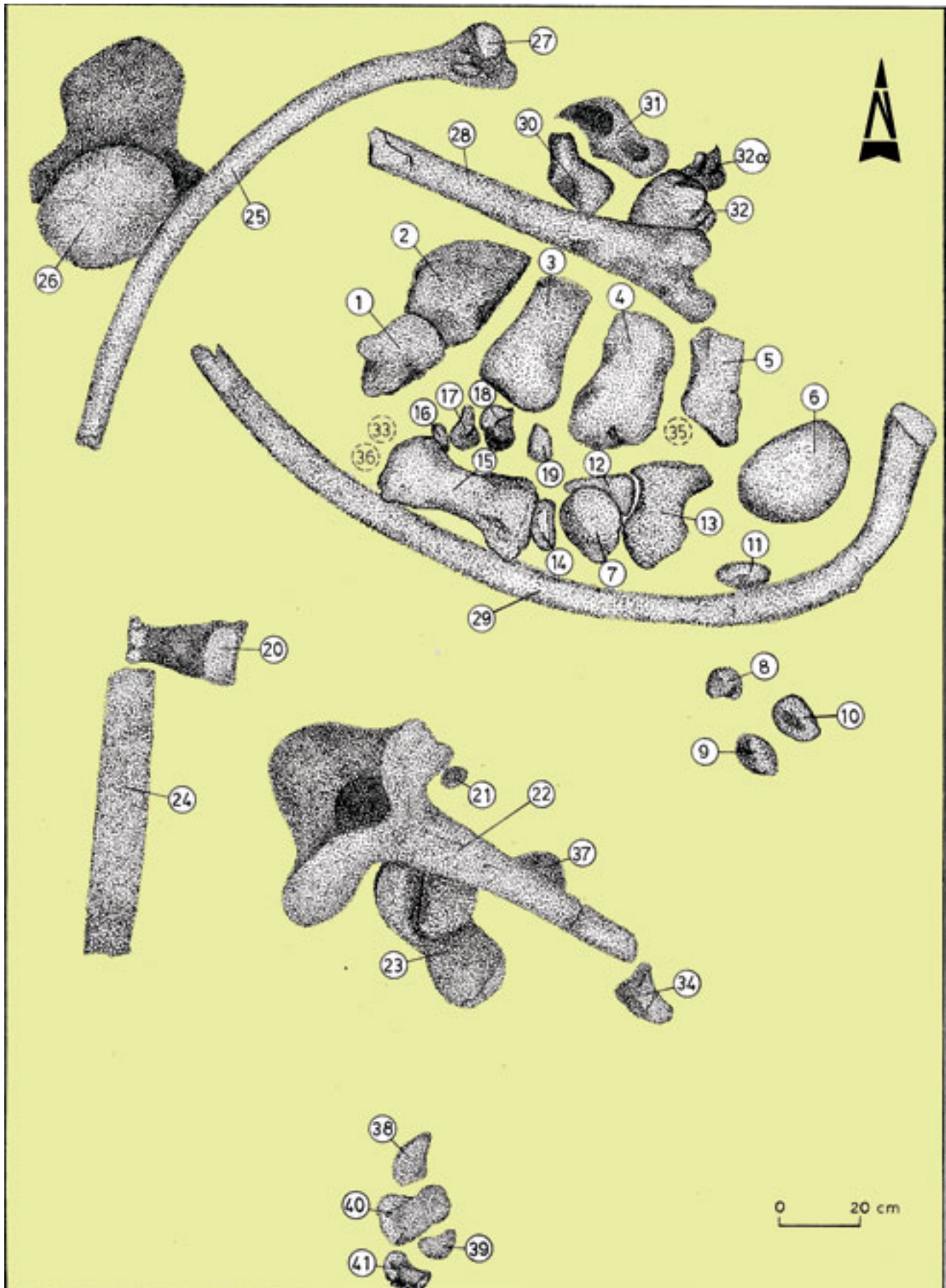
Επιπέδωση του οστέινου σκελετού του ελέφαντα (Lopholophus) που βρέθηκε στο σπήλαιο του Γρεβενού. Ο αριθμός των οστών είναι ο ίδιος με τον αριθμό των οστών που φαίνονται στην εικόνα.