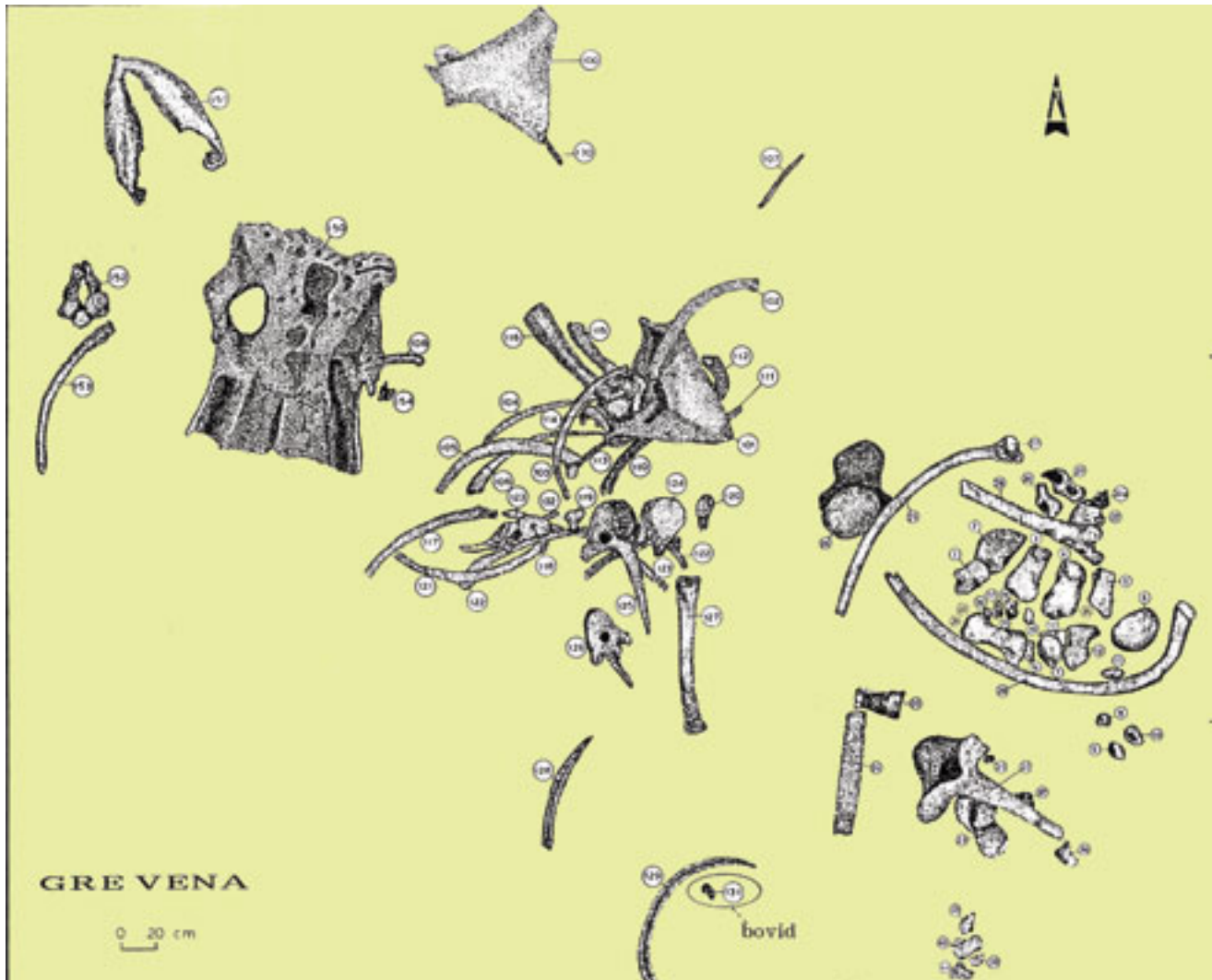
Σχέδιο κάποιων ανασκαφών (1990-1995) πούλακέρχεντομελέτητολ στοήβρεθίκαρ, κατά τη διάρκεια της ανασκαφής (1990-1995).