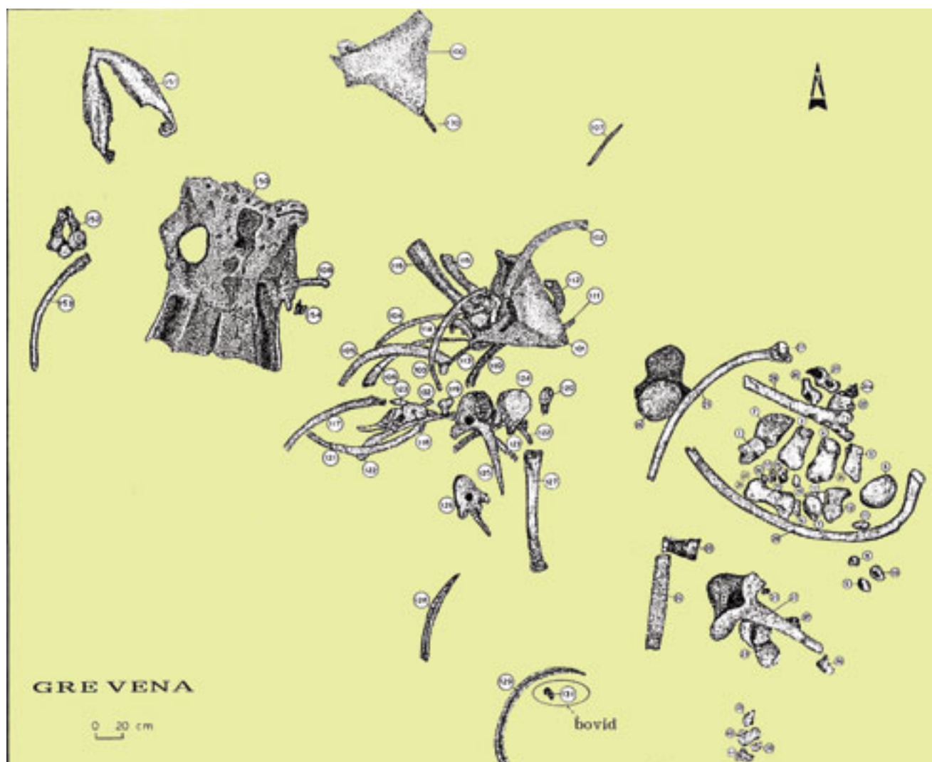
Σχέδιο κειμήλιων ανασκαφής (1990-1995) πύλας Γρεβενών, με τάρπη στο σύμπλοκο, κατά τη διάρκεια της ανασκαφής (1990-1995).