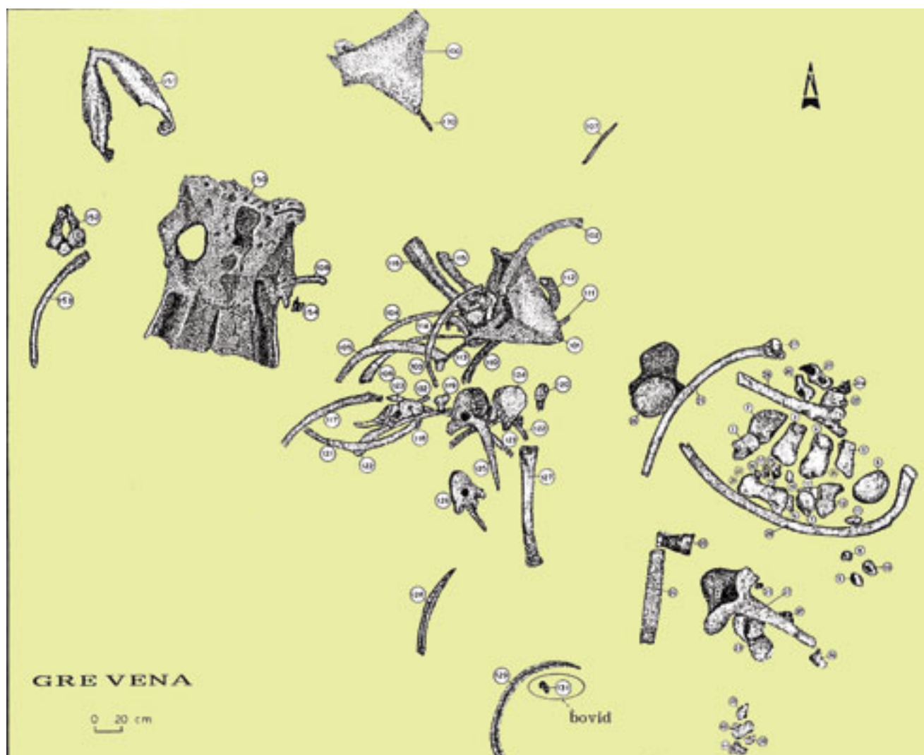
Σχέδιο κειμήλιων ανασκαφής (1990-1995) πύλας Γρεβενών, με τάρπη στο σύβριθ της, κατά τη διάρκεια των ανασκαφών (1990-1995).