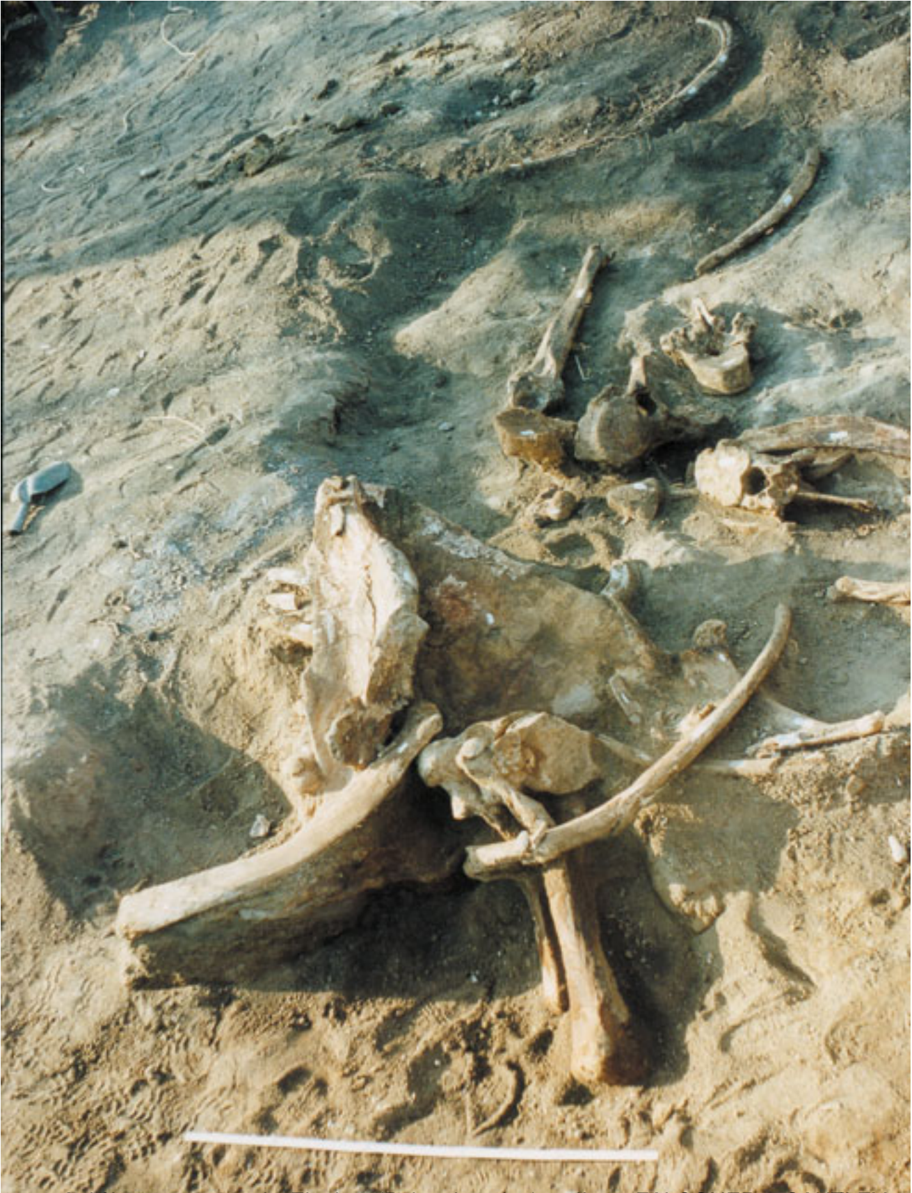
Επιπέδωση του σκελετού του ελέφαντα που βρέθηκε στα Γρεβενά. Ο ελέφαντας ζούσε κατά τη διάρκεια της Μεσολιθικής εποχής.