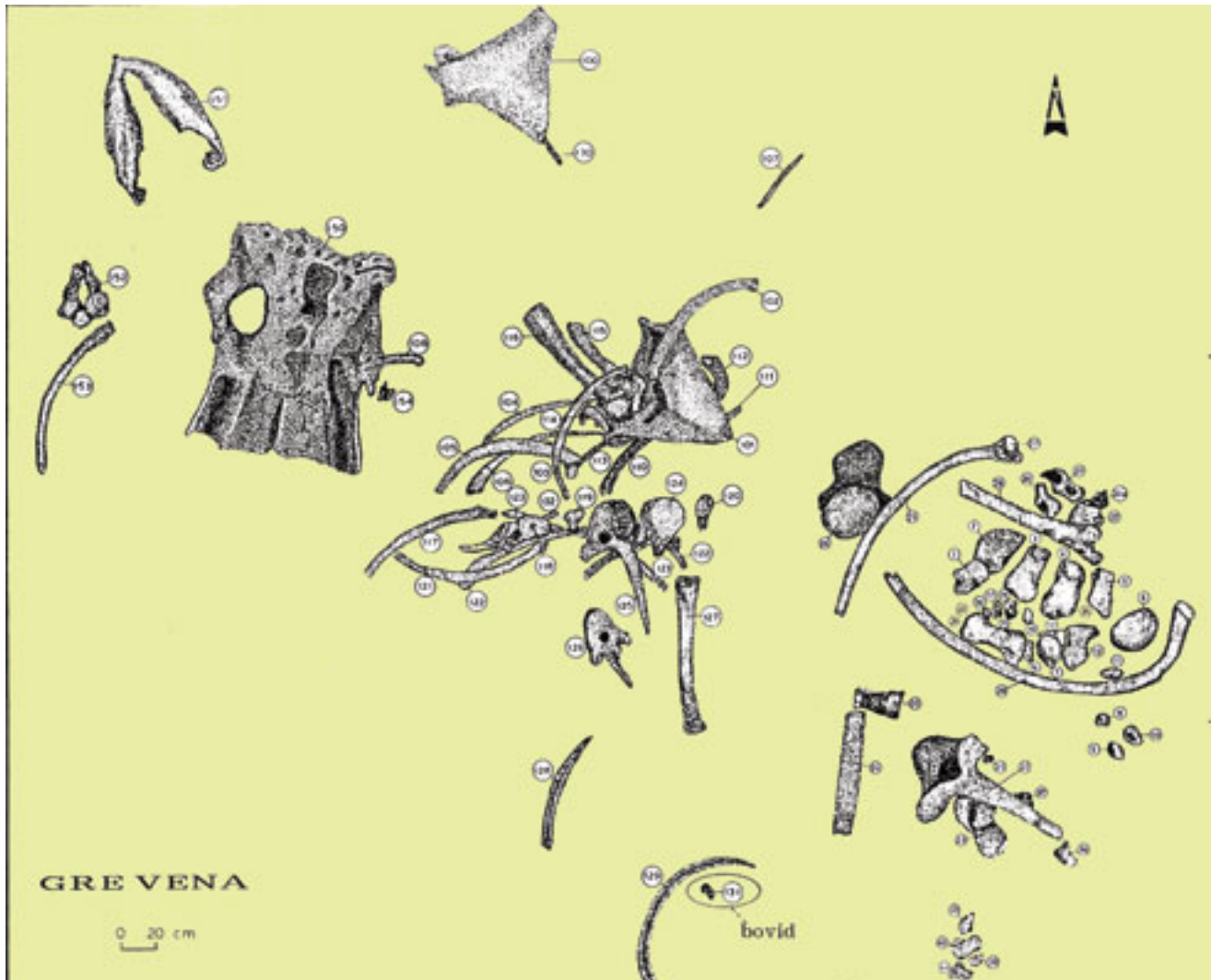
Σχέδιο κειμήλιων ανασκαφής (1990-1995) πύλας Γρεβενών, μετέφρητο στο βραχίονας, κατά τη διάρκεια των ανασκαφών (1990-1995).