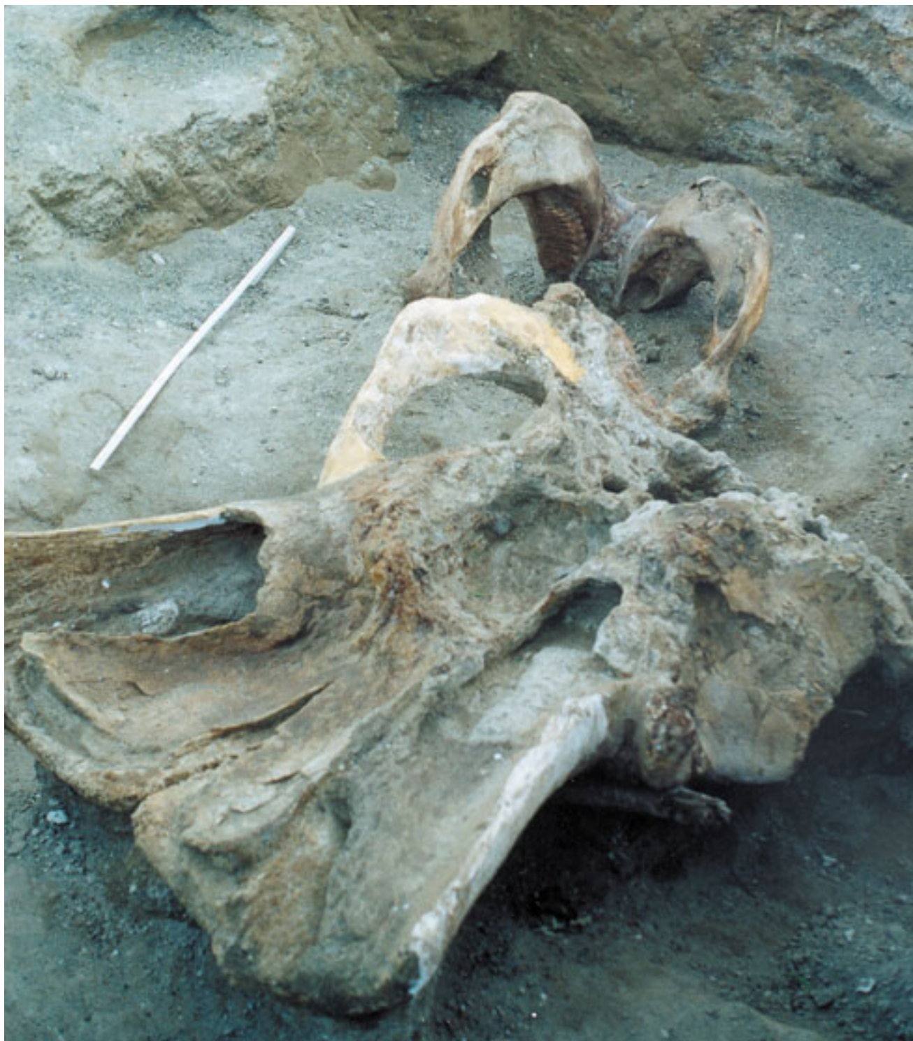
Φωτογραφία του (πλάι) ανασκαφής του 1995, όπου διακρίνονται το κρανίο (εμπρός) και η