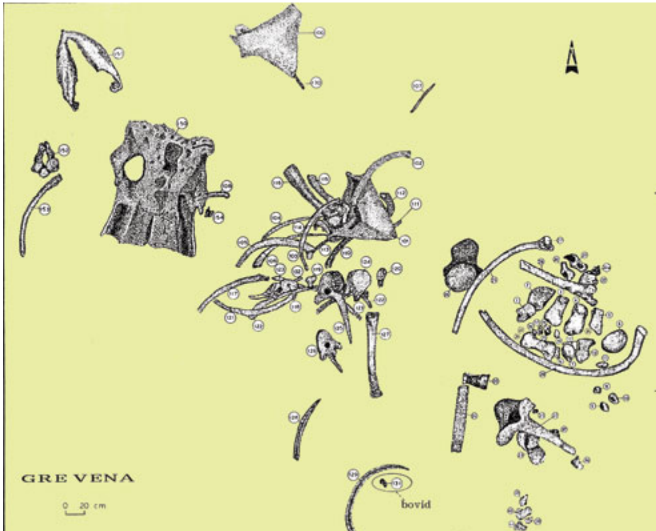
Σχέδιο κειμήλιων ανασκαφής (1990-1995) πύλας Γρεβενών, με λεπτομέρεια στο ήβραϊο της, κατά τη διάρκεια της ανασκαφής (1990-1995).