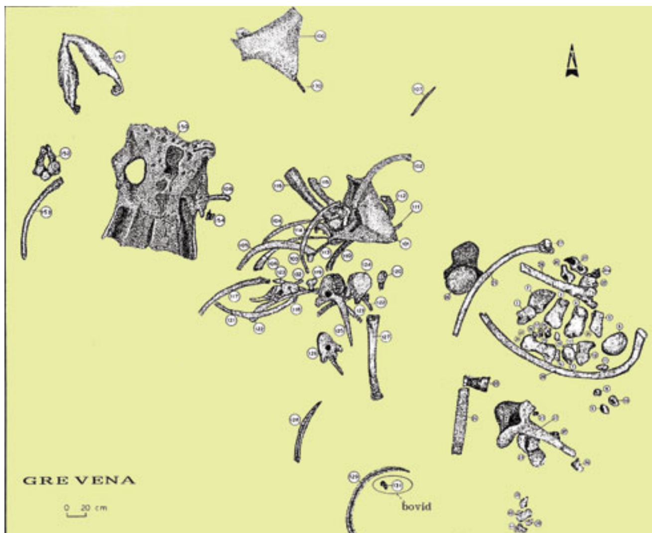
Σχέδιο κειμήλιων ανασκαφής (1990-1995) πούλιας Γρεβενών, με έμφαση στο σύμπλεγμα, κατά τη διάρκεια της ανασκαφής (1990-1995).