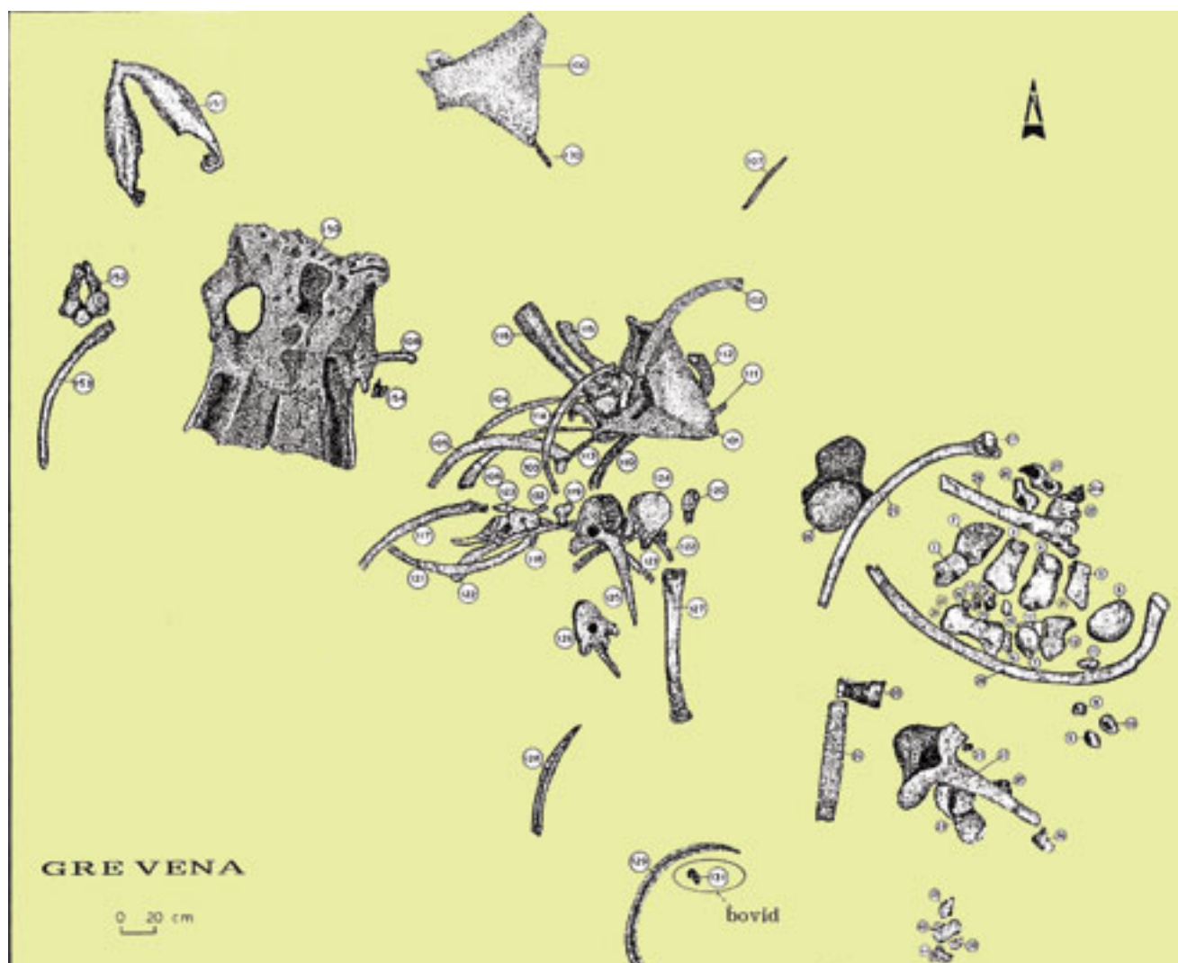
Σχέδιο κειμήλιων ανασκαφής (1990-1995) πούλιας Γρεβενών, με λεπτομέρεια στο ήβραϊο, κατά τη διάρκεια των ανασκαφών (1990-1995).