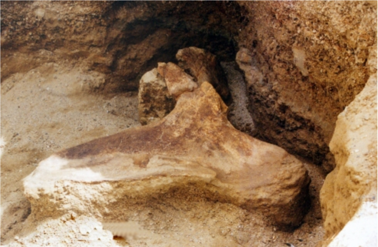
Σει. 2002, πύλη 2, στο ανώτερο μέσο τμήμα του στήθους, βραχίονα και μηριαίου. Λαδίζονται όμοια ζώα